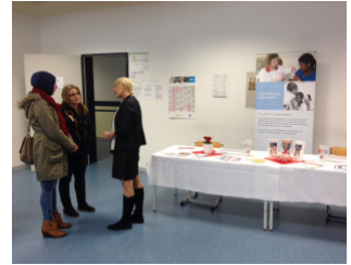
WSSRK on Tour auf Messen