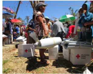
DRK-Hilfeinsatz auf der Philippinen