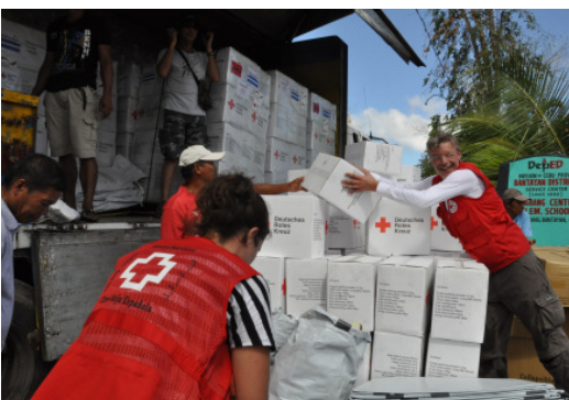
Verteilung der Hilfsgüter auf Bantayan

Supertaifun Haiyan brach am 8. November 2013 mit gewaltiger Zerstörungskraft über große Teile der philippinischen Inselgruppe Visayas herein. Die Windgeschwindigkeiten betragen bis zu 315 km/h und