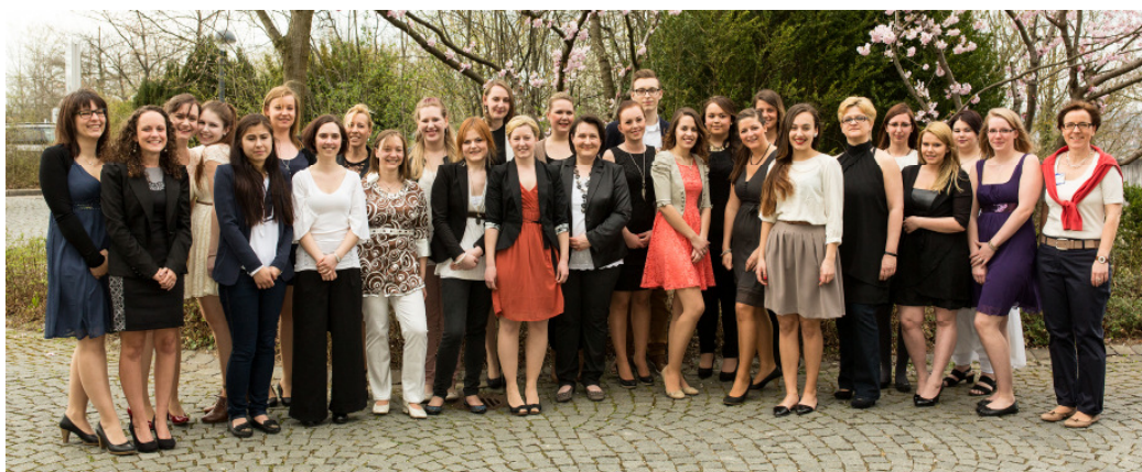
Frischexamierte Gesundheits- und Krankenpfleger sowie Gesundheits- und Kinderkrankenpfleger der Schule für Pflegeberufe der ALB FILS KLINIKEN