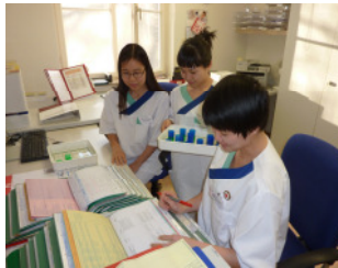
Modellprojekt in der Altenpflege